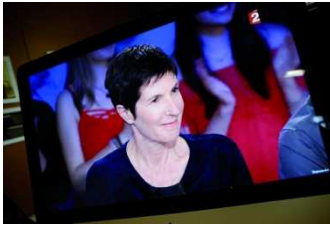
Christine Angot

Son nouveau roman, Un tournant de la vie , paraîtra le 29 août chez Flammarion. Trois ans après le succès d' Un amour impossible (Flammarion) qui lui avait valu le prix Décembre 2015, Christine Angot publiera son nouveau roman, Un tournant de la vie . Programmé pour la rentrée littéraire prochaine.